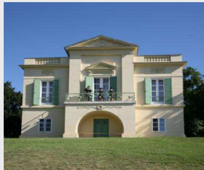
Rybniční zámeček v Lednici