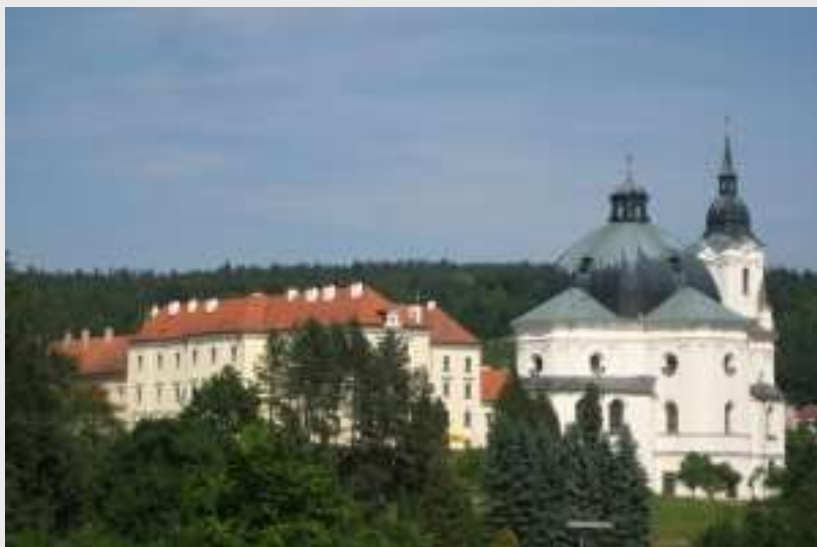
Zámek ve Křtinách